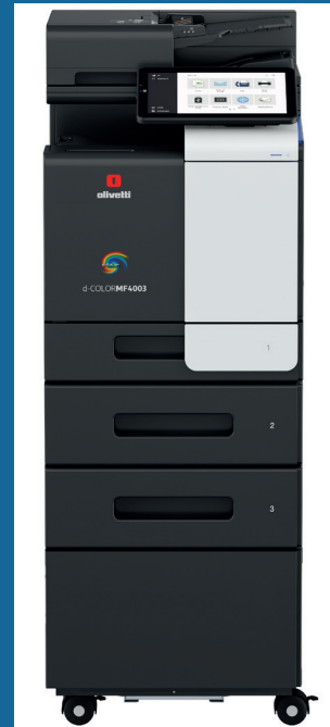
CONFIGURACIÓN CON PEDESTAL Y DOS CASSETTES OPCIONALES