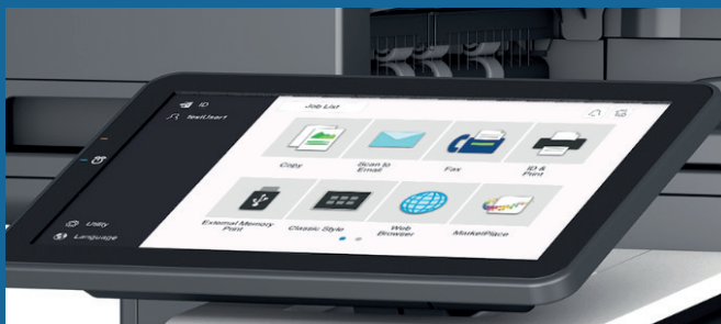
PANTALLA TÁCTIL A COLOR DE 10.1"