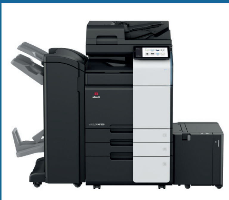
d-Color MF309 con DF-714+PC-416+LU-302+RU-513+FS-536SD