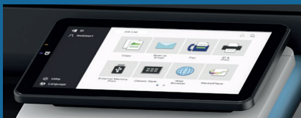
Nueva pantalla táctil de 10,1"